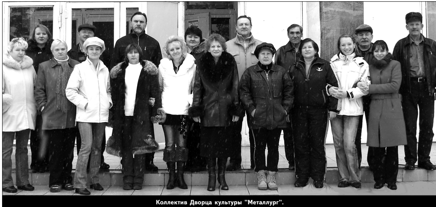
Коллектив Дворца культуры "Металлург".

О спортивных мероприятиях марта читайте на стр. 3.