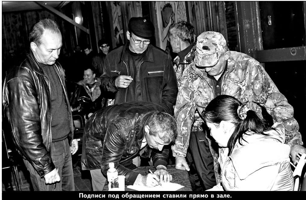
Подписи под обращением ставили прямо в зале.

19 октября в СДК с. Во-стрецово на традиционный слет собрались охотники-любители Красноармейского района. Это мероприятие проводит Красноармейский райзаготхотпром (РЗОП) накануне охотничьего сезона. Главным вопросом является организация сезона охоты 2012-2013 года, а также подводятся итоги работы предприятия в текущем году по сдаче дикоросов и пушнины. А еще вопросы, консультации, дискуссии и, конечно же, награждение лучших. Но были и нерадостные моменты.