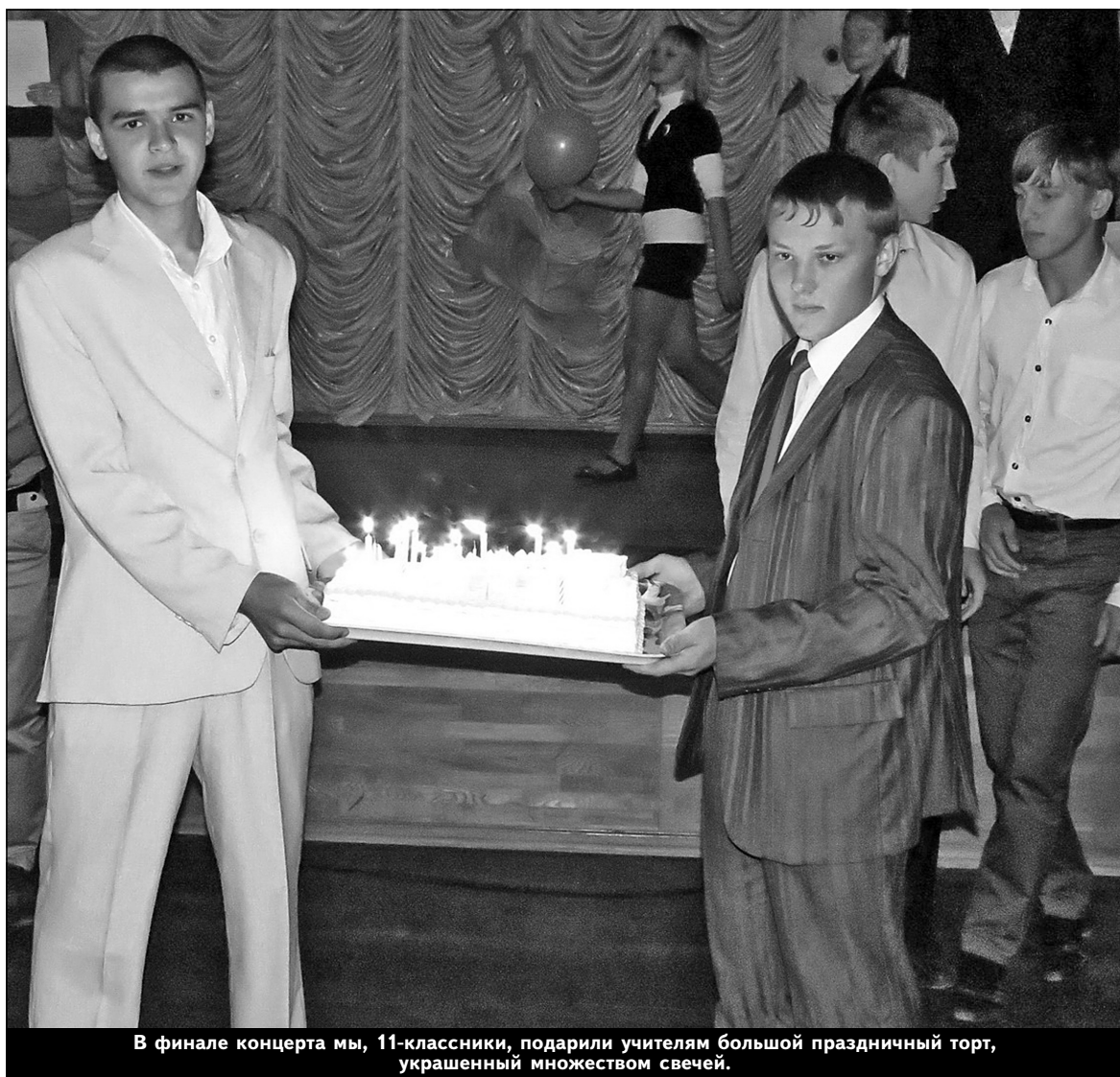
В финале концерта мы, 11-классники, подарили учителям большой праздничный торт, украшенный множеством свечей.