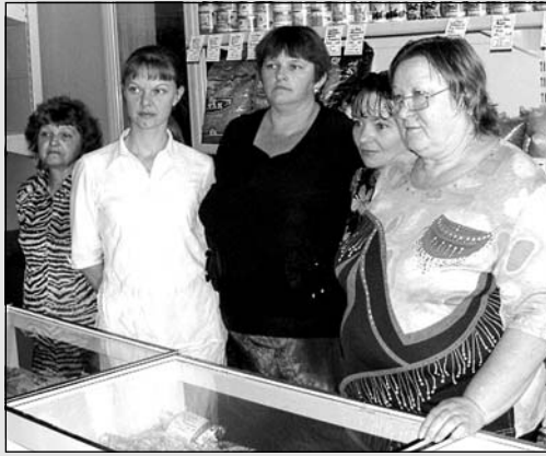
Коллектив магазина "Елена".