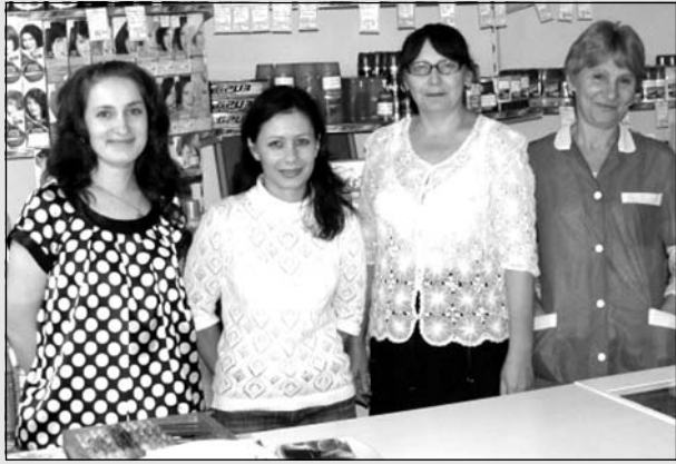
Коллектив магазина "Радуга".