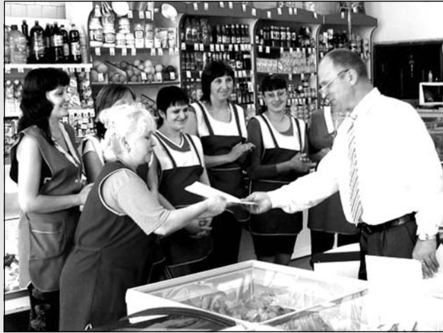
Поздравления принимает коллектив "Ласточки".