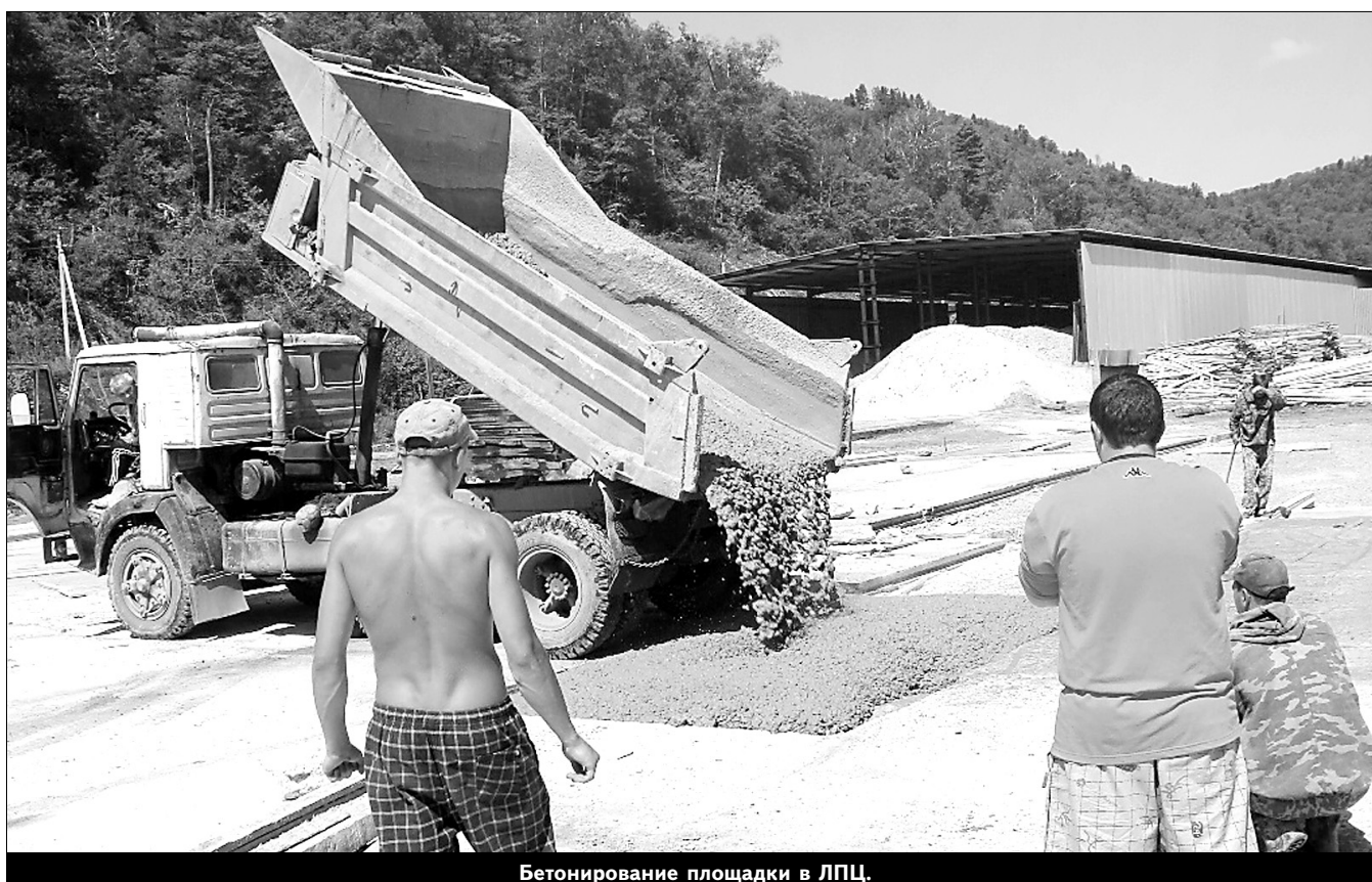
Бетонирование площадки в ЛПЦ.

Строительство можно по праву назвать наиболее востребованным направлением внутрихозяйственной деятельности ОАО "ГРК "АИР" и Приморского ГОКа. Причина этого проста: развитие предприятий требует новых объектов, а благоустройство поселка - новых работ. Если вы увидите "Срочно требуются", то это - в ремонтно-строительный цех. В августе его работники отметили свой профессиональный праздник, а днем рождения ремонтно-строительного цеха (РСЦ) значится 1 июля 2006 года.