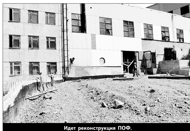
Идет реконструкция ПОФ.

С запуском асфальтового завода обновлено покрытие на ряде участков улиц. В июне уложено 1860 кв. м асфальта, в июле - еще 1900. Кроме этого, во дворах обновлены детские площадки: установлены качели, отремонтированы горки. По просьбе жителей ул. Дымова работники цеха братья Нестеренко выполнили большую часть работ по строительству детской площадки. В этом РСЦ плотно работает с цехом ЖКХ, которым руководит Анатолий Гасюк, - совместно разрабатывают планы, корректируют в случае необходимости. Стоит отметить и спортив-