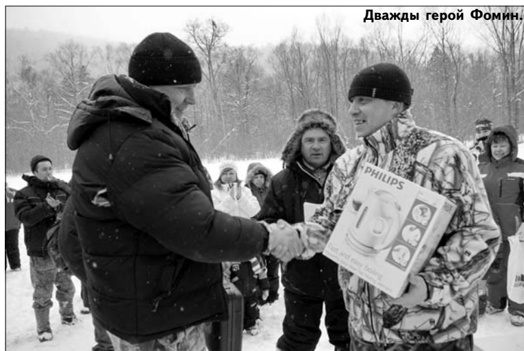
Дважды герой Фомин.