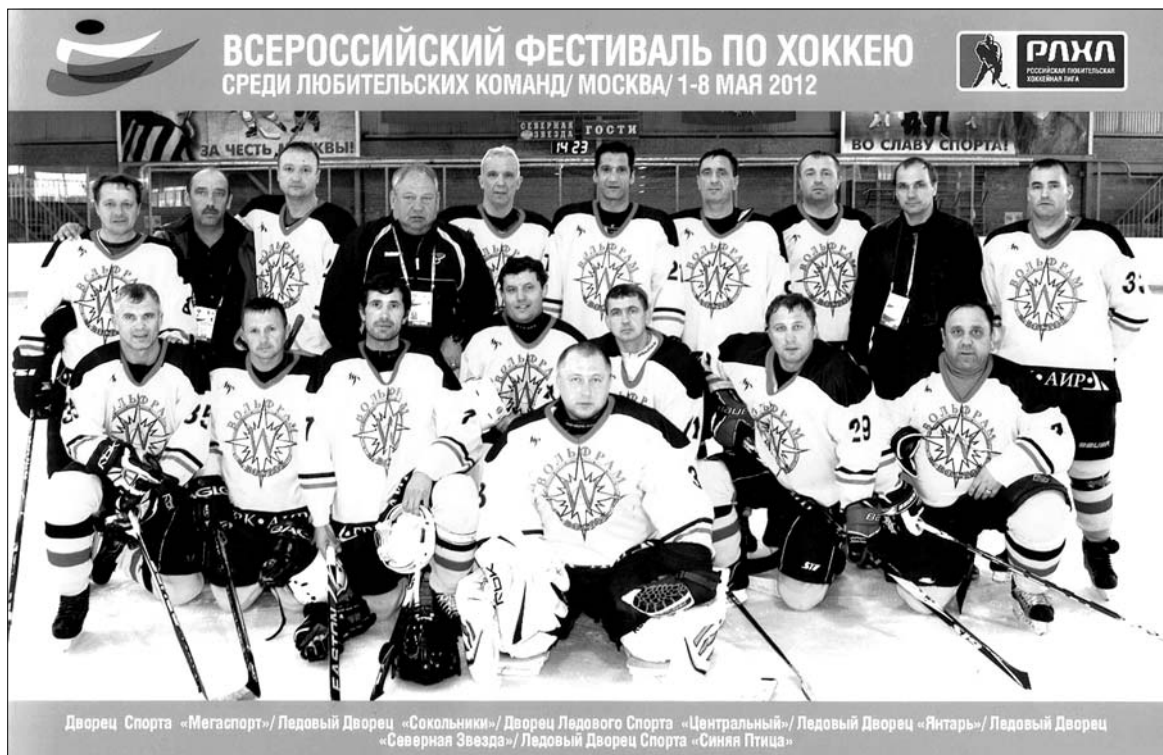
Дворец Спорта «Мегаспорт»/Ледовый Дворец «Сокольники»/ Дворец Ледового Спорта «Центральный»/ Ледовый Дворец «Янтарь»/ Ледовый Дворец «Северная Звезда»/ Ледовый Дворец Спорта «Синяя Птица»

Российская любительская хоккейная лига (РЛХЛ) была основана в 2011 году по инициативе председателя Правительства РФ Владимира Путина. Цель организации - популяризация любительского хоккея, развитие массового спорта, координация "ночных лиг". Президентом РЛХЛ является Александр Якушев, председателем правления - Вячеслав Фетисов. Лига насчитывает девять конференций, в ее мероприятиях участвуют более 1000 команд из 74 регионов страны.