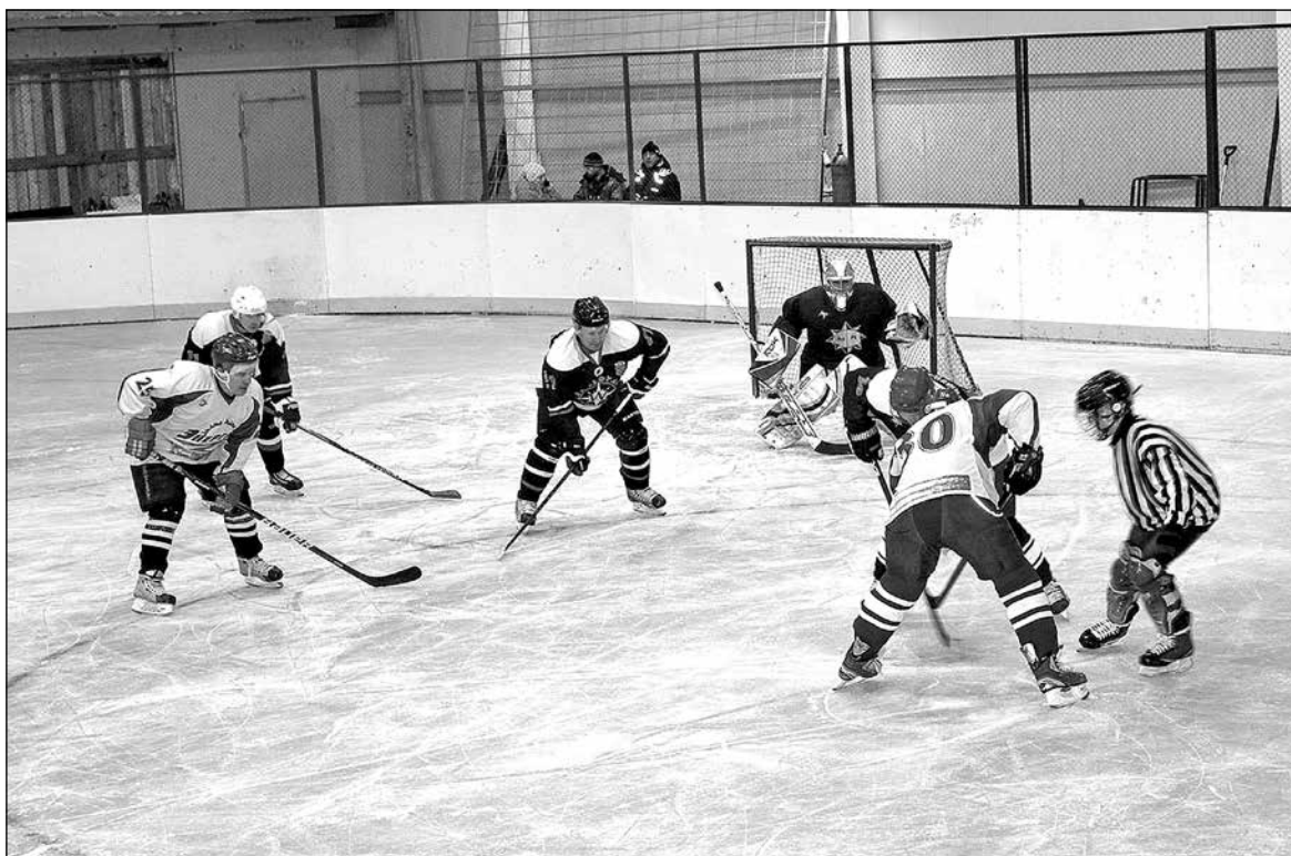
Лига ОТВ среди любительских команд по хоккею на кубок губернатора Приморского края сезона 2015-2016 г.г.