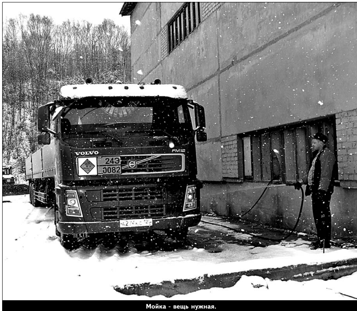
Мойка - вещь нужная.

АТЦ - самое крупное и разветвленное подразделение. В его составе трудятся 149 человек. У него своя богатая история, свои традиции и - огромный список обязанностей, о которых, скорее всего, знают далеко не все востокчане. Сюда входит подвоз, закладка, дробление руды, строительство и содержание дорог, включая лесные, возведение мостов и сооружений. Множество работ выполняется по благоустройству: асфальтирование, очистка улиц и тротуаров, сбор и вывозка бытовых отходов, подсыпка дорожного полотна, поливка, обустройство противопожарной минполосы и ликвидация возможных ЧС. На совести цеха даже ритуальные услуги. Собственно перевозки - вывоз леса и продукции лесоперерабатывающего комплекса, готовой продукции и реагентов, снабжение всем необходимым производства и торговых предприятий, транспортировка людей к месту работы и организация выезда спортсменов, артистов или школьников. Понятно, что в силу специфики поселка представить жизнь в нем без АТЦ невозможно. В структуре цеха, помимо собственно транспортного парка, находятся складское хозяйство и АЗС. Производственные площадки расположены в самом поселке и на промплощадке. Основное хозяйство наверху, именно там находятся стояночные боксы для большегрузов, база тяжелой механизации, ведутся основные ремонтные работы. И.о. механика Сергей