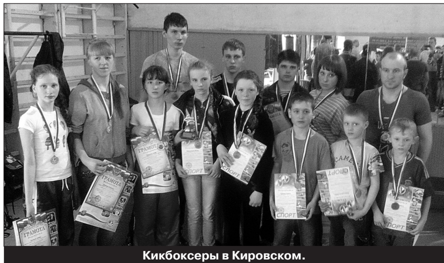
Кикбоксеры в Кировском.