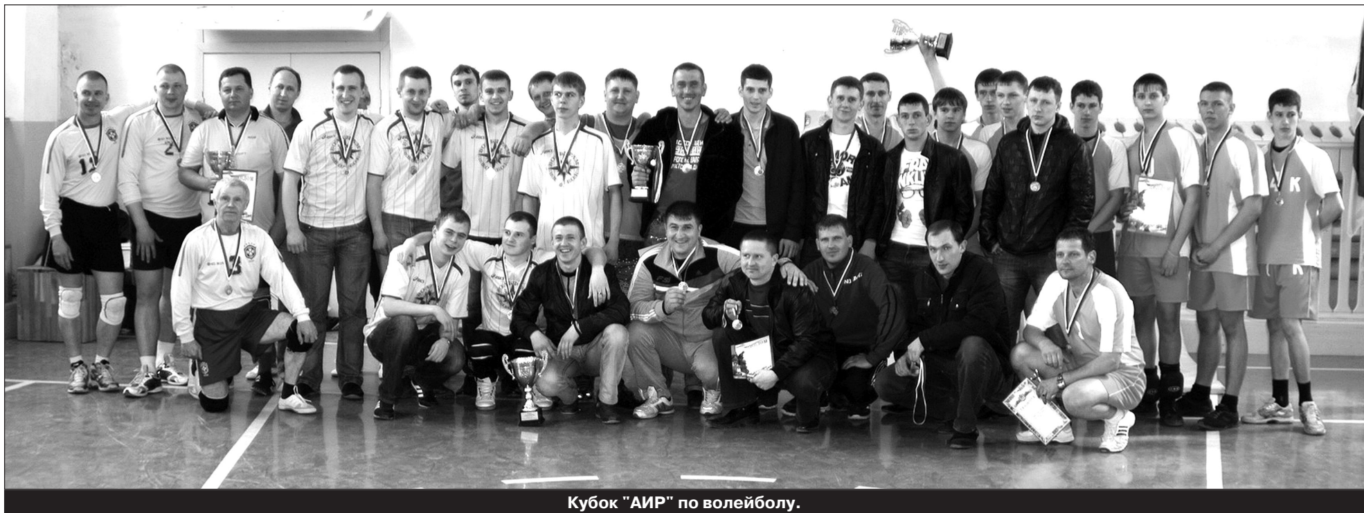
Кубок "АИР" по волейболу.